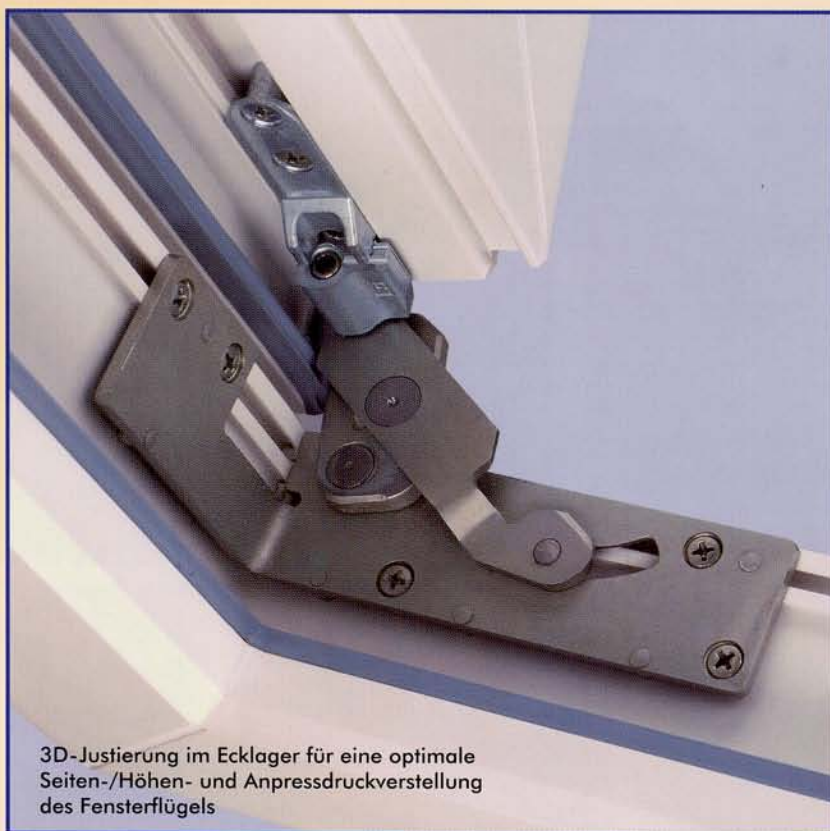
3D-Justierung im Ecklager für eine optimale Seiten-/Höhen- und Anpressdruckverstellung des Fensterflügels

Wartungsarm. Spezielle Fettdepot-Taschen sorgen für eine Dauerschmierung der Laschen und reduzieren den Verschleiß