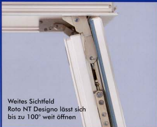
Weites Sichtfeld Roto NT Designo lässt sich bis zu 100° weit öffnen

Dabei gilt: Je weniger man von der Technik eines Fensters sieht, desto besser. Hier setzt Roto NT Designo Maßstäbe. Keine von außen sichtbaren Bänder, keine Abdeckkappen, die sich lösen könnten, nichts stört die Optik des Fensters. Roto hat diesen verdeckt liegenden Beschlag mit seinem eleganten, mattsilbernen Design von Grund auf neu entwickelt. Für schöne Holz- und Kunststofffenster, die Ihnen auch im Objektbau interessante Perspektiven eröffnen.